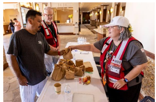
ホテルのロビーで食料品を提供するボランティア